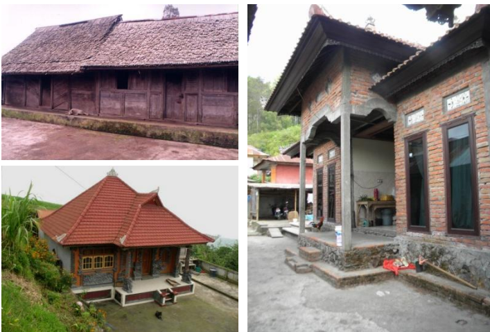
Gambar 2. Bangunan rumah tinggal tradisional asli (kiri atas), perubahan bentuk rumah tinggal di kebun (kiri bawah), dan perubahan bentuk rumah tinggal di desa induk Sukawana (kanan)

Bangunan rumah tinggal di desa Sukawana sudah banyak berubah bentuk meniru bangunan di perkotaan. Fasade yang terbentuk dari deretan tiang dan dinding yang merata/seragam, kini berubah dengan sentuhan tempelan-tempelan ornamen artistik berupa ukiran dan atau sentuhan focal point pada pintu masuk ke dalam rumah, dan ada pula yang dilengkapi dengan teralis. Bentuk atap bangunan pada mulanya pelana, sekarang berubah menjadi limasan.