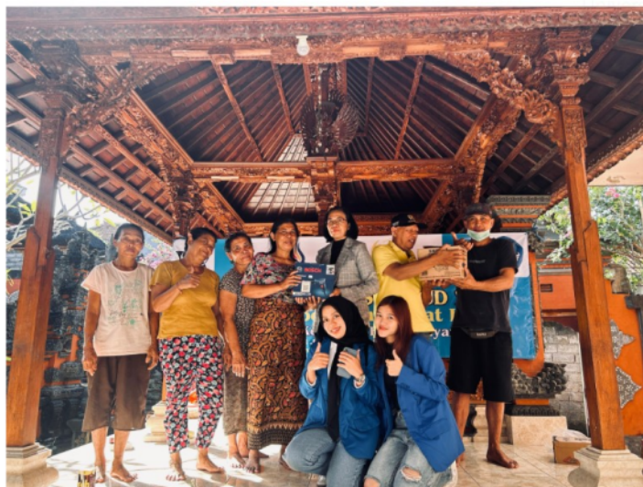
Gambar 3. Kegiatan menyerahkan bantuan alat teknologi tepat guna

pendampingan praktik akuntansi dasar dan berbasis teknologi; c) membantu wirausaha kelompok seni pahat kayu, melalui pelatihan manajemen produksi dengan menerapkan teknologi untuk mendukung proses produksi manual. Persoalan yang dihadapi mitra selanjutnya diatasi melalui PKM meliputi 3 bidang ilmu yaitu: Manajemen, Ilmu Komputer, dan Akuntansi. Berdasarkan uraian di atas, maka untuk mitra telah dilaksanakan serangkaian kegiatan.