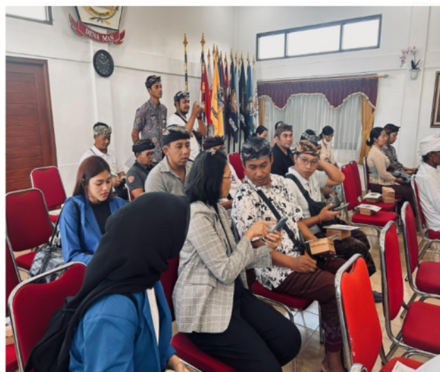
Gambar 4. Pelatihan pemasaran digital dengan menggunakan aplikasi media sosial