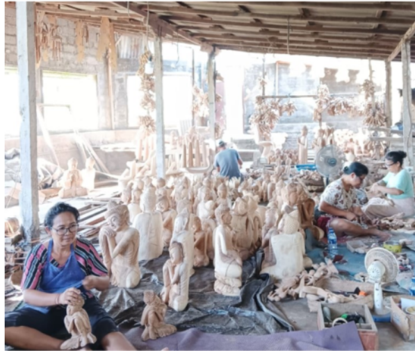
Gambar 2. Aktivitas kelompok seni pahat kayu di Desa Mas, Ubud

Adanya persaingan kompetitif, di sisi lain, produk-produk kriya kayu memiliki nilai estetika dan nilai fungsional, maka sudah seharusnya produksi dan pemasaran menjadi lebih inovatif. Untuk menarik perhatian generasi muda menekuni usaha ekonomi produktif ini dan memberikan gambaran peluang yang menjanjikan sudah tentu harus mengikuti konsep dan teori bisnis modern yang menerapkan kewirausahaan dan digitalisasi. Seperti penelitian terdahulu yang menyatakan bahwa perilaku kewirausahaan industri berkontribusi dalam penyebaran budaya. Dari perspektif manajemen, orientasi kewirausahaan merupakan pendekatan strategis untuk proaktif, berani mengambil risiko dan inovatif dalam memenangkan persaingan bisnis (Hikmah et al., 2023). Kewirausahaan sebagai sikap, karakter, dan kemampuan wirausahawan memanfaatkan peluang dan menciptakan nilai berkontribusi memberi manfaat bagi organisasi, konsumen, pemasar, dan mitra di usaha kecil menengah (Sari et al., 2023).